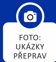
FOTO: UKÁZKY PŘEPRAV